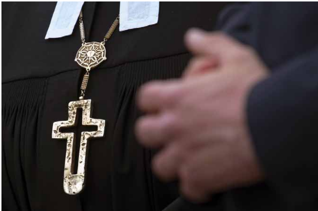
L'étude allemande révélée en début d'année fait état de 2225 victimes et de 1259 auteurs connus entre 1946 et 2000. Le rapport évoque toutefois jusqu'à 10 000 victimes potentielles.